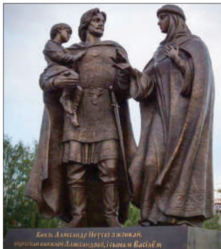
Рис. 2. Памятник князю Александру Невскому с женой, витебской княжной Александрой и с сыном Василием. Витебск. Республика Беларусь.

Обращу особое внимание на то, что Александровские игры – это не только спортивные состязания, а большой комплекс культурных, образовательных, информационных, исторических, развлекательных мероприятий, которые объединяют Всероссийский