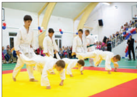
Рис. 8. Занятия в секции рукопашного боя.

Важной составляющей здесь, безусловно, является включённость и заинтересованность многих людей, готовых помогать и участвовать – словом, делом, молитвой, финансами – в общем деле создания и поддержания этого уникального комплекса. И мы готовы поделиться этим опытом с теми, кто неравнодушен и стремится также сделать что-то хорошее и важное на уровне своего района, своего города. Ведь только так, начиная с малого, можно достичь больших результатов и изменить мир вокруг к лучшему. ■