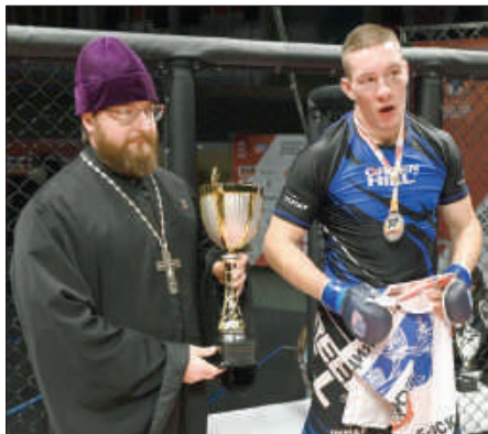
Рис.2. Вручение Кубка председателя Патриаршей комиссии по вопросам физической культуры и спорта «За волю к победе» на Всероссийском турнире по смешанному боевому единоборству в городе Омске. Ноябрь 2023 года.