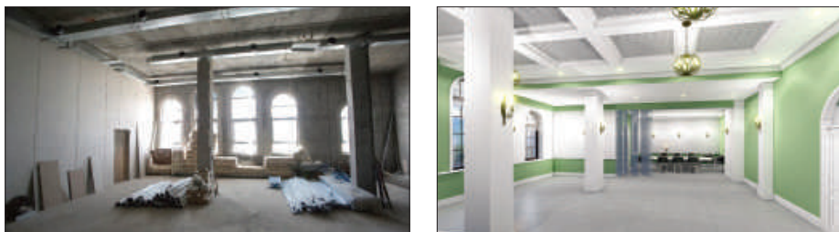
Рис.4. Преобразование внутренних помещений духовно-спортивного центра.

Залы центра оснащены современным инвентарём и тренажёрами. Они были закуплены на средства гранта в рамках проекта «Формирование физической подготовки и здорового образа жизни детей и молодёжи в условиях Крайнего Севера в неразрывной связи с духовной подготовкой». Для работы спортивной части центра был заключён договор с Министерством спорта Мурманской области о привлечении тренеров спортивных школ для работы со спортсменами по следующим направлениям: самбо, дзюдо, классическая греко-римская борьба и общефизическая подготовка (ОФП).