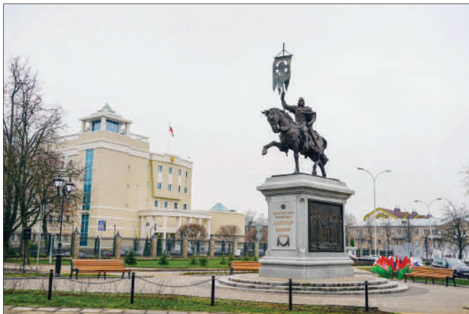
Рис. 1. Памятник святому благоверному великому князю Александру Невскому. Минск. Республика Беларусь.

Искренне рад, что получившая благословение Святейшего Патриарха инициатива проведения Всероссийских спортивных игр святого благоверного князя Александра Невского в 2024 году выходит за пределы Российской Федерации и обретает масштаб события Союзного государства России и Беларуси. Впервые в 2024 году в этих соревнованиях будет принимать участие белорусская команда спортсменов, как об этом уже сказал отец Александр Ширитон. К сожалению, на сегодняшний день спорту в церковной среде Беларуси не придаётся должной значимости. Есть единичные, точечные проекты, которые вдохновляются инициативой отдельных священнослужителей и мирян. Хотелось бы добавить этим явлениям масштабности и массовости. Я вижу в привитии физической культуры и спорта в церковном сообществе прекрасную возможность привлечь в церковь молодёжь с её энергией и полнотой сил.