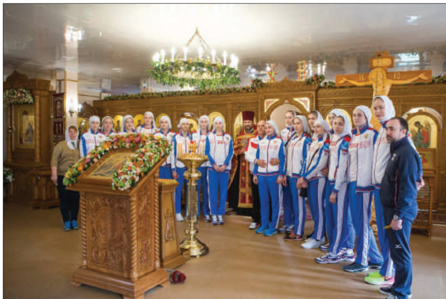
Рис. 6. Женская юношеская сборная России по волейболу в храме святого благоверного великого князя Дмитрия Донского в районе Северное Бутово (Москва).

который выделяется не только масштабом, но и органичным включением в свой состав большого количества социальных объектов.