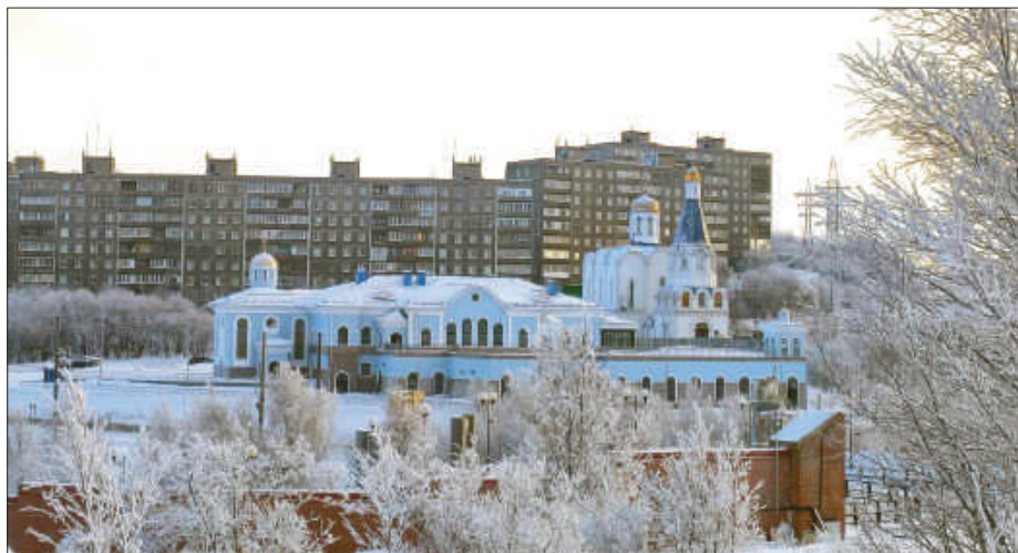
Рис.6. Общий вид комплекса духовно-спортивного центра и церкви Спаса-на-Водах.

Такова краткая история создания необычного и нестандартного для Церкви комплекса – духовно-спортивного центра. Его строительство в Мурманске стало примером партнёрства Церкви и государства на новом уровне. Уверены, что участие Церкви в реализации подобных проектов в области спорта принесёт добрые плоды, а воспитание юных спортсменов в духе православных истин выведет российский спорт на новый уровень успеха. ■