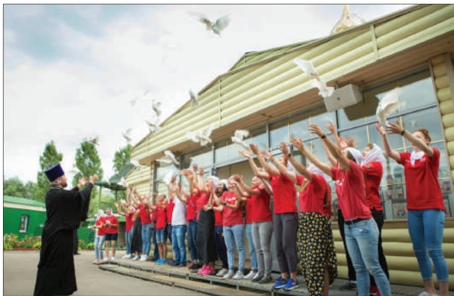
Рис. 5. Женская сборная России по хоккею в гостях у культурно-просветительского центра «Восход».

В настоящее время в целях дальнейшего развития центра в рамках Программы строительства православных храмов в городе Москве осуществляется строительство нового храмового комплекса во имя святого благоверного великого князя Димитрия Донского,