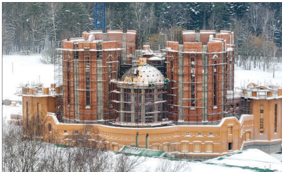
Рис. 9. Строительство храмового комплекса во имя святого благоверного великого князя Димитрия Донского с многофункциональным социально-культурным центром, включающим в т.ч. спортивную инфраструктуру.