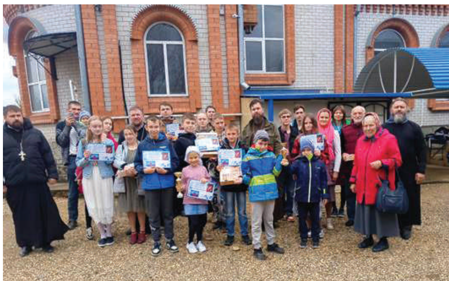
Рис.5. Общая фотография участников турнира с родителями и организаторами.

держит высокую степень теологичности. Она присутствует и в других компьютерных играх, но в StarCraft выражена наиболее чётко и определённно. Война племён, являющаяся основой сценария игры, – это квинтэссенция эпического фэнтези, война между фантастическими видами (гуманоидами и негуманоидами) и людьми. Теология в StarCraft просматривается не только в этом триединстве. Здесь присутствует тема вечной борьбы добра со злом и места в ней человека. Зерги (вымышленная раса инопланетян) рассматриваются как воплощение «мирового зла», стереотип которого можно усмотреть и в религиозном сегменте. Протоссы (вымышленная раса гуманоидов со сверхспособностями), напротив, являются воплощением добра и справедливости, ради которой они должны воевать и даже идти на насилие. При этом указывается, что и протоссы, и зерги созданы одной инопланетной негуманоидной расой – Ксел’Нага, и авторы игры дают людям надежду, что рано или поздно они помирятся, что соответствует библейской притче об Армагеддоне и судном дне, но одновременно входит и в протосское учение «Хала» о неизбежном противостоянии рас, в