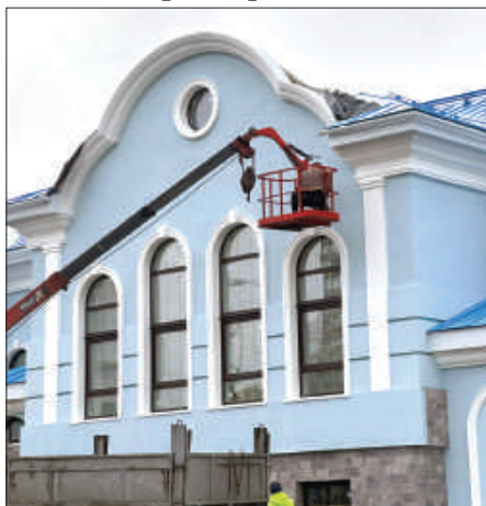
Рис.5. Фасад духовно-спортивного центра.

Работа над необычным проектом стала приятным вызовом для всей нашей команды, была интересной и захватывающей. Совместно решались задачи и преодолевались проблемы, которых немало вставало на пути проектирования и строительства объекта. В частности, этот период совпал со временем, когда осуществлялась смена строительных норм и правил, произошло резкое и скачкообразное повышение цен на строительные материалы – всё это требовало постоянной напряженной работы как подрядчика, так и технического заказчика, авторского надзора. Ещё один большой блок проблем связанный с подключением к сетям инженерно-технического обеспечения, электроснабжения и связи был успешно решен при поддержке организаций-балансодержателей сетей.