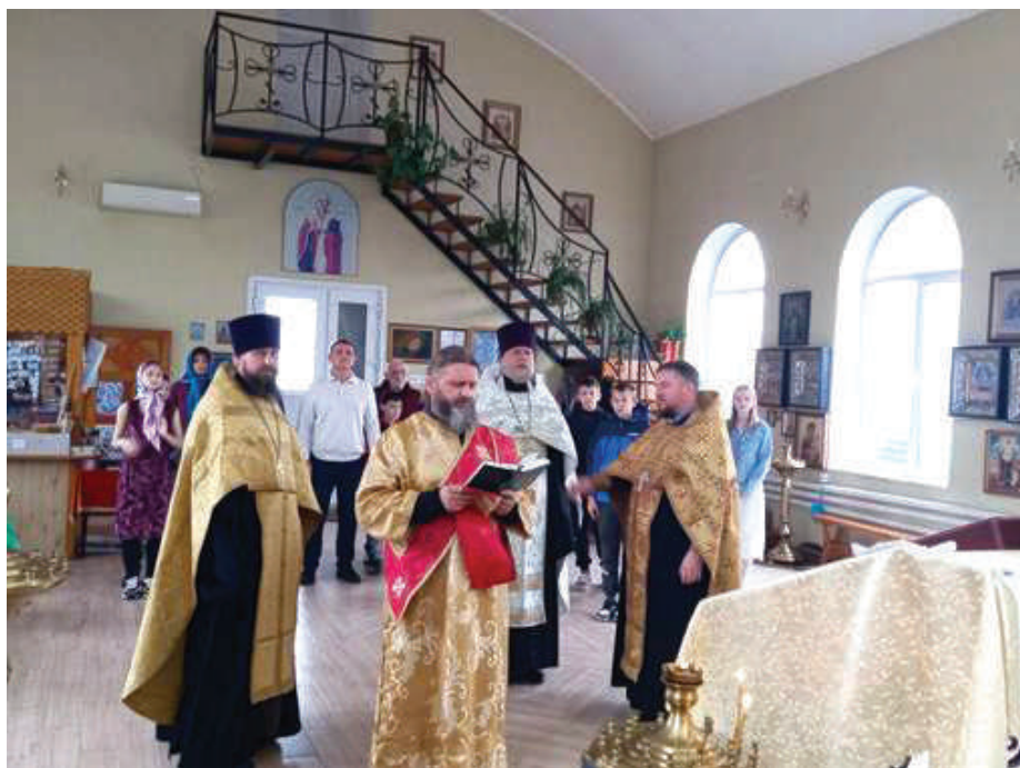
Рис. 1. Служба перед началом интеллектуального турнира «Да будем мы едины». Воскресная школа храма святителя Митрофана Воронежского ст. Прочноокопской Армавирской епархии.

базе воскресной школы храма святителя Митрофана Воронежского ст. Прочноокопской Армавирской епархии. В мероприятии, приуроченном ко Дню народного единства 4 ноября, который совпадает с днём Казанской иконы Божьей Матери, приняли участие представители Армавира, Новокубанска, Лабинска, а также станиц Бесскорбная и Прочноокопская. Турнир состоял из двух частей: викторины, затрагивающей исторические факты, связанные с образом Казанской иконы Божией Матери и событиями 1612 года, а также соревнований по компьютерной игре-головоломке «Тетрис» [1]. По завершении турнира состоялся опрос в электронном виде его участников (24 человека), их родителей и присутствовавшего на мероприятии духовенства (26 человек). Тем самым в исследовании приняло участие 50 респондентов, поделённых на две группы: дети в возрасте до 18 лет и взрослые.