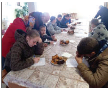
Рис. 2. Участники турнира отвечают на вопросы викторины.

На второй вопрос: «Что, по вашему мнению, не совсем получилось?» среди взрослых ответы: «всё получилось» – 50 %, «недостаточно практики» – 30 %, «неумение играть» и «нехватка теоретических знаний» – 10%. Ответы детей следующие: «всё получилось» – 68 %, «недостаточно практики» – 24 %, про «нехватку знаний» сообщили 8 % респондентов. В ответах явно прослеживается тенденция зависимости оценки респондента от полученных им в соревновании результатов, тем не менее около четверти участников отметили недостаток практики, опрос не смог выявить, связано это с игрой именно в «Тетрис» или вообще с недостатком у респондентов игровых компьютерных навыков.