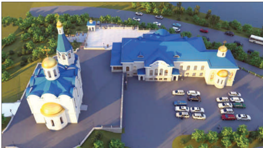
Рис.1. Дизайн-макет комплекса духовно-спортивного центра и церкви Спаса-на-Водах.

часовнями – зданиями, предназначенными для богослужений и проведения религиозных обрядов и церемоний, всё чаще возводятся духовно-просветительские центры, соединяющие в себе функции музеев, выставочных залов, воскресных школ. На базе таких заведений возрождаются местные ремесла, проводятся научные конференции, раскрывается история регионов. Всё это привлекает всё больше молодежи, людей среднего возраста, повышает туристический потенциал той или иной местности.