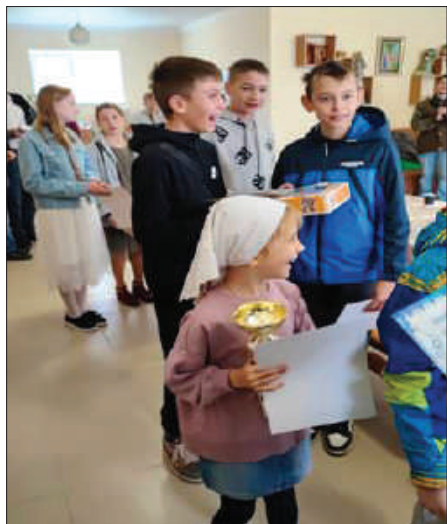
Рис. 4. Победители турнира «Да будем мы едины» со своими наградами.

На завершающий седьмой вопрос: «Поделитесь мнением о формате мероприятия» ответ среди родителей: «и викторина, и компьютерные состязания важны и по-своему нужны» набрал 100 %. А вот среди детей мнения разделились: «и викторина, и компьютерные состязания важны и по-своему нужны» ответили 80 %, ответы «викторина не нужна, нужно больше времени для игры» составили 20 %. Таким образом, данный формат был поддержан большинством голосов, хотя при-