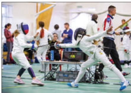
Рис. 3. Детско-юношеский турнир по фехтованию «Серебряная шпага».