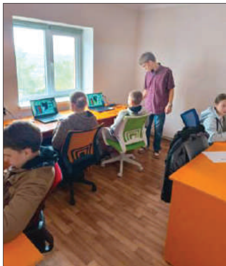
Рис. 3. Участники турнира играют в компьютерную игру-головоломку «Тетрис».

На пятый вопрос: «Стоит ли далее проводить подобные формы работы?» родители ответили однозначно «да» – 100 %, дети – 93 % «да», «не знаю» – 7 %. Судя по тому, что ответов «нет» не было ни в одной из групп, а положительная оценка максимально высокая в обеих группах, можно сказать, что данную форму работы следует развивать и в дальнейшем.