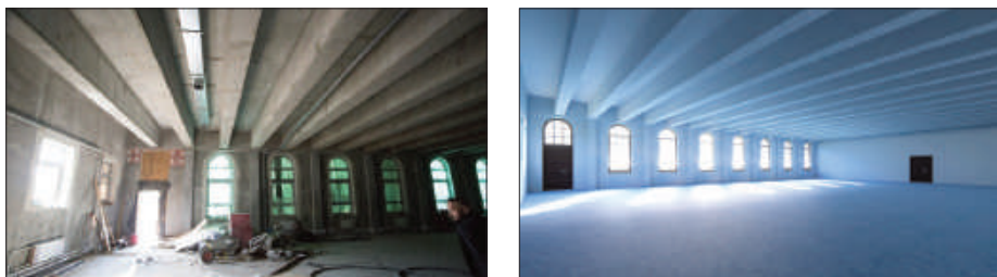
Рис. 3. Спортивный зал духовно-спортивного центра.

низкой отметке позволило соблюсти нормативные требования к высотам помещений данного функционального назначения.