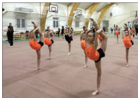
Рис. 4. Занятия спортивной секции по художественной гимнастике.

Воспитанники разных подразделений центра успешно выступают на различных конкурсах, соревнованиях и фестивалях, демонстрируя высокий уровень знаний и подготовки в своих областях. Деятельность центра при храме предоставляет широчайшее поле для церковной миссии, поскольку многие родители приходят сюда, чтобы отдать на занятия своих детей, и с этого постепенно начинается их духовный путь, приобщение к вере и литургической жизни Церкви.