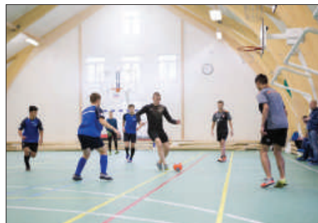
Рис. 2. Детско-юношеский турнир по мини-футболу «Кубок дружбы».

История центра началась 13 лет назад, когда Святейший Патриарх Московский и всея Руси Кирилл благословил начать его работу и дал ценные советы по организации деятельности, которая включала бы дошкольное воспитание, начальное и среднее образование, а также дополнительное образование, предлагающее кружки и секции самых разных направленностей.