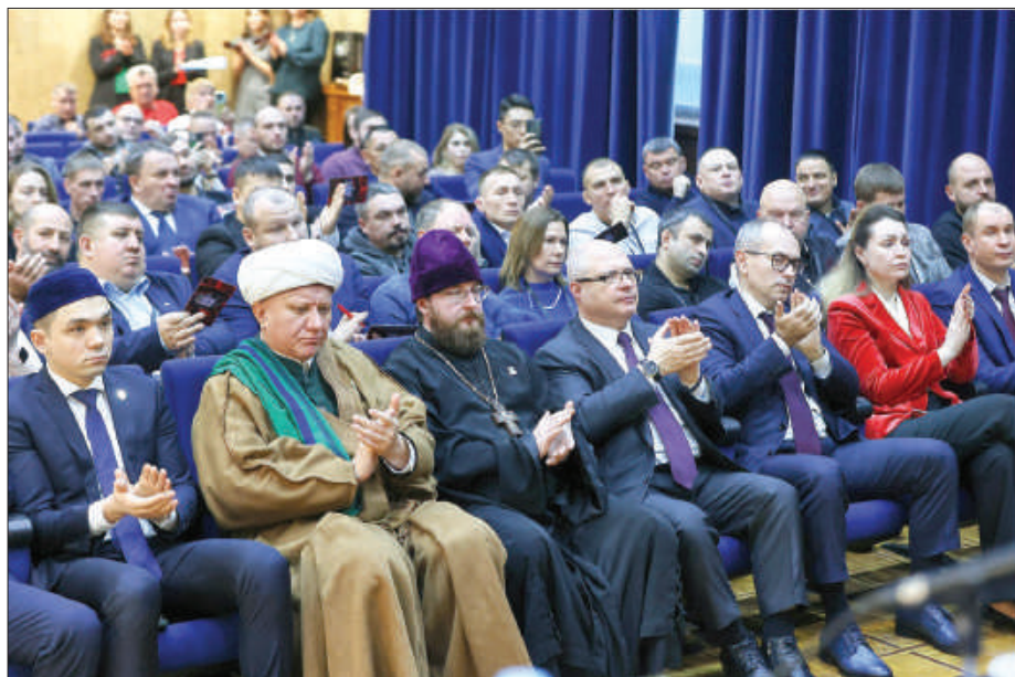
Рис.4. Представители религиозных конфессий России на отчетно-выборной конференции Союза ММА России. 15 декабря 2023г.

духовно-нравственного и патриотического воспитания спортсменов. Учитывая опыт Новосибирской епархии, в качестве одного из докладчиков на данную конференцию пригласили и меня. В своём сообщении мною была сделана попытка простым и доступным языком определить такие понятия, как патриотизм, мораль, нравственность и духовность, рассмотреть различные трактовки понятия «духовность» и обосновать, что по аналогии с занятиями спортом под руководством тренера духовное воспитание немыслимо без участия священника. Состоявшееся после доклада обсуждение выявило дефицит духовного общения не только у православных, но и у спортсменов, исповедующих традиционный ислам. Итогом Всероссийской конференции явилось предложение рассмотреть возможность создания при Союзе ММА России отдела по духовно-нравственному воспитанию спортсменов, разработать положение об отделе и обдумать его формат. В ходе обсуждения вышеозначенных вопросов с руководством Союза ММА и президентами региональных федераций было предложено: