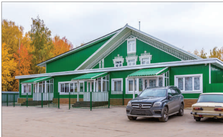
Рис. 1. Спортивный комплекс культурно-просветительского центра «Восход» при храме святого благоверного великого князя Дмитрия Донского в районе Северное Бутово (Москва).

лее 10 лет успешно функционирует культурно-просветительский центр «Восход» 1 .