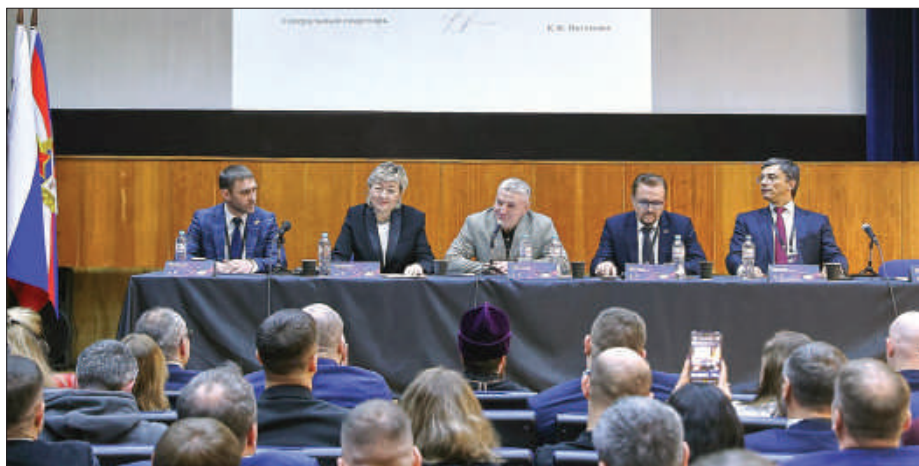
Рис.3. Отчетно-выборная конференция Союза ММА России. 15 декабря 2023г.

Но самым успешным и плодотворным миссионерским подходом стало сопровождение священником в качестве духовника сборной Новосибирской области по ММА на выездных соревнованиях. Уже первый опыт показал эффективность такого начинания. Во-первых, присутствие священника в сборной воодушевило самих спортсменов, во-вторых, не оставило равнодушной ни одну из команд – участниц турнира. Палитра эмоций была от простого интереса до суеверного страха – мол, привезли с собой священника – сейчас всех «порвут». Ко мне как духовнику новосибирской сборной подходили представители делегаций из других городов – знакомились, задавали вопросы о том, как организовать подобное взаимодействие в их регионах. Эти вопросы не были праздным любопытством. Общение с руководителями региональных федераций, тренерским составом позволило сделать вывод о том, что запрос на духовное воспитание у спортсменов весьма высокий. Этот интерес выразился в том, что 25 июня 2023 года в г. Москве Союзом ММА России была проведена Всероссийская конференция на тему