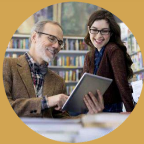
Деятели науки и просвещения