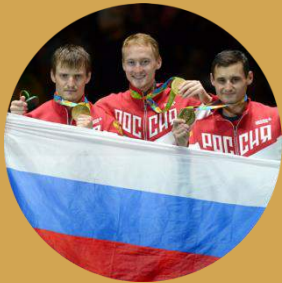
Лидеры спортивного сообщества