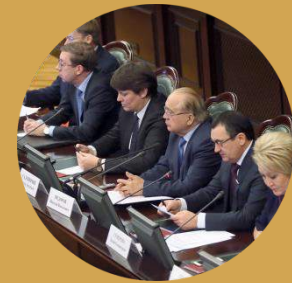
Руководство федеральных и региональных органов государственной власти