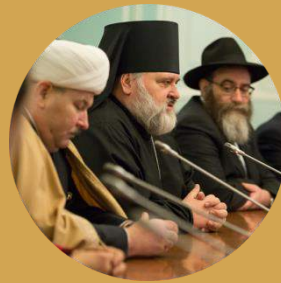
Представители традиционных конфессий