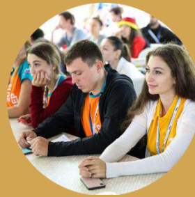
Общественные организации и институты развития